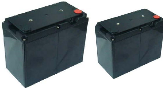
Billede: De 2 typer Power Lithium Batterier

Hvert batteri har indbygget LED indikator og elektronik, der overvåger spænding, strøm, temperatur og sikrer balancering af de indre celler.